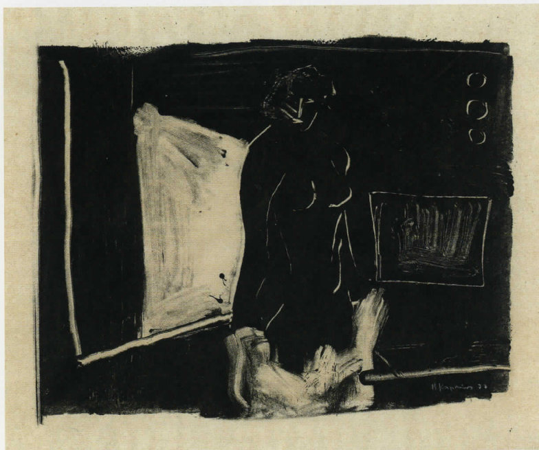
άρ. κατ. 55