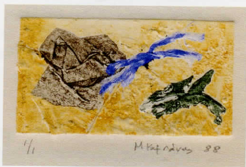
ἀρ. κατ. 49

1986, μονοτυπία, 10 x 13,3. 46. Προφήτης Ἡλίας Σίφνου VII, 1986, μονοτυπία, 10 x 13. 47. Προφήτης Ἡλίας Σίφνου VIII, 1986, μονοτυπία, 10 x 13. 48. Νεκρὴ φύση, 1988, μονότυπο ἀπὸ κολλάζ, 3,3 x 6. 49. Νεκρὴ φύση, 1988, μονότυπο ἀπὸ κολλάζ, 3,3 x 6. 50. Τοπίο, 1988, μονότυπο ἀπὸ κολλάζ, 3,3 x 6. 51. Τοπίο, 1988, μονότυπο ἀπὸ κολλάζ, 3,3 x 6. 52. Τοπίο, 1988, μονότυπο ἀπὸ κολλάζ, 3,3 x 6. 53. Ποταμὸς (Ἀχέρων) I, 1974, μονοτυπία, 29,7 x 34,6. 54. Ποταμὸς (Ἀχέρων) II, 1974, μονοτυπία, 30 x 35. 55. Γυμνὸ μπροστὰ σὲ μπερντέ, 1977, μονοτυπία, 21,5 x 27. 56. Χωρὶς τίτλο, 1988, μονότυπο ἀπὸ κολλάζ, 5 x 6. 57. Χωρὶς τίτλο, 1988, μονότυπο ἀπὸ κολλάζ, 5 x 6. 58. Χωρὶς τίτλο, 1988, μονότυπο ἀπὸ κολλάζ, 5 x 6. 59. Χωρὶς τίτλο, 1988, μονότυπο ἀπὸ κολλάζ, 5,3 x 6,4. 60. Χωρὶς τίτλο, 1988, μονότυπο ἀπὸ κολλάζ, 5,3 x 6,4. 61. Χωρὶς τίτλο, 1988, μονότυπο ἀπὸ κολλάζ, 5 x 6. 62. Χωρὶς τίτλο, 1988, μονότυπο ἀπὸ κολλάζ, 5,5 x 6,3. 63. Ἱστορία τοῦ δέντρου, 2005, μονοτυπίες, 166 x 46